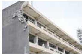
⑪ 무너진 벽