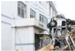
⑫ 겹겹이 쌓인 차량