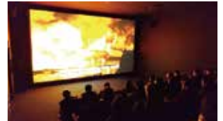
② 영상 시어터